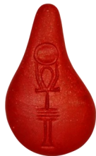
Stein der Harmonie, einer der Hauptpreise

Wer kann teilnehmen? Jeder von nah und fern, der den Weg in die Rathenower Straße 5A findet. Die Eiersuche wird für die Kinder ausgerichtet. Natürlich darf man den Kleineren behilflich sein bzw. auf der Entdeckungstour über das weiträumige Gelände helfen. Stattfinden kann das Fest dank der vielen engagierten Helfer von Förderverein „Jugendzentrum Elb-Havel-Winkel e.V.“ und „Modellsportzentrum 2000 Havelberg e.V.“.