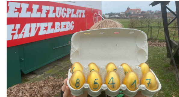
Suchgelände: Modellflugplatz, Rathenower Straße 5A

Wer auf dem Areal des Modellflugplatzes ein goldenes Ei gefunden hat, kann es gegen einen der gespendeten Hauptpreise eintauschen. Einer der Hauptpreise mutet mystisch an. Es handelt sich um ein Schmuckstück mit „harmonischer“ Wirkung. Spender: www.hexagonal.com , ein Online-Shop aus Havelberg.