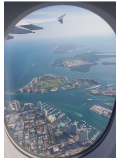
Kurz vor der Landung in Miami

Wieder Lust, den Urlaub in einem anderen Land zu verbringen? Du wirst mehr davon haben, wenn du dich gut verständigen kannst. Was hältst du von einem Kurs, um dein (Urlaubs-) Englisch aufzufrischen?