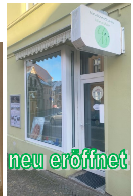
Neu eröffnet: Kosmetikstudio in der Scabellstraße