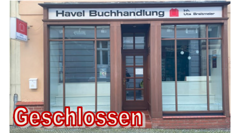
Geschlossen: Buchhandlung in der Marktstraße

Als Redaktion wollen wir helfen, Geschäfte sichtbar zu machen. Weiter: Seite 2.