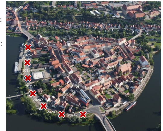
Unsere schöne Altstadt-Insel

Vielleicht lässt sich so aus einigen Schaufenstern die BUGA'15 Deko ausräumen und für eine Geschäftseröffnung schmücken? Das Jahr 2024 wird ein Jahr, in dem vor Ort mehr angepackt werden darf. Der Mut zurückkehrt, dass sinnvolle Entscheidungen örtlich getroffen werden, statt abzuwarten, dass jemand auf entfernterer Ebene an Havelberg denkt und lenkt. Was ist dein wichtigstes Projekt im neuen Jahr?