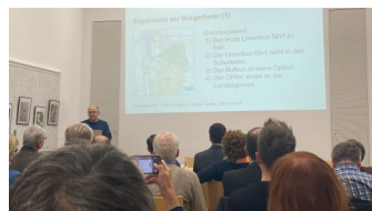
Präsentation der Ergebnisse am 18.12. im Haus der Flüsse

Wer würde einen Bus nutzen, wenn dieser zeitlich und örtlich anders fährt? Wäre privates oder öffentliches Carsharing eine Alternative?